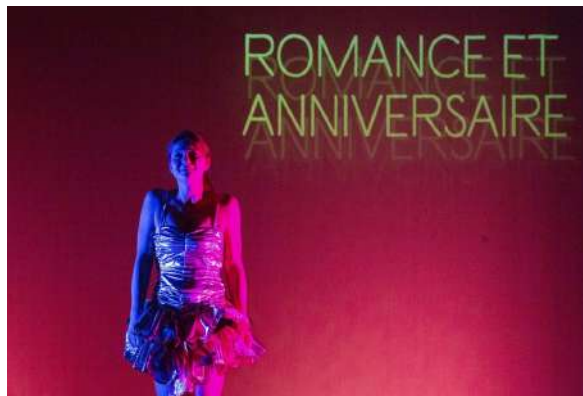
"37 Heures" ou la terrible emprise, à La Scala.

Par Alice COURTIEUX, Marie Pétry Publié le 15/07/25