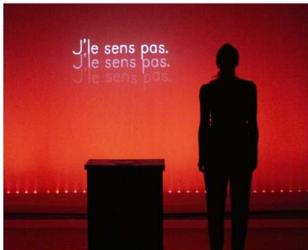
Elsa Adroguer.

37 heures retrace avec beaucoup de justesse et de simplicité le parcours d'une adolescente confrontée à des violences sexuelles.